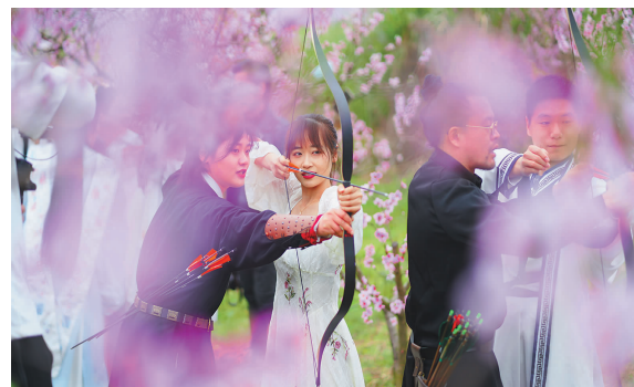
此次策划执行云上桃花节活动,是至逸公司仙渡项目迈出的第一步,受到了社会各界的广泛关注。除丽水日报外,学习强国、丽水文旅、丽水网、莲都文旅、莲都融媒体中心等都通过微信公众号、视频号等形式宣传仙渡桃花盛开美景,为今后仙渡文旅产业开发打下良好基础。

本报讯(吴莹)2021年12月,浙江至逸文化发展有限公司成立,打开了集团文旅板块的新篇章。今年2月,丽水至逸文旅有限公司作为招商引资项目在仙渡乡成立,公司承接了第一个活动项目——“春满仙渡·云赏桃花”2022年仙渡云上桃花节。受疫情影响,为减少人员聚集,活动通过航拍直播、金牌导游直播、云相册、摄影大赛等线上活动形式,全方位、多角度品鉴、记录、展现仙渡红色桃花小镇的美丽风光和山海协作乡村振兴成果。活动将持续至4月中旬,云相册直播、摄影大赛都在如火如荼地进行中,欢迎大家关注,更期待大家的佳作。