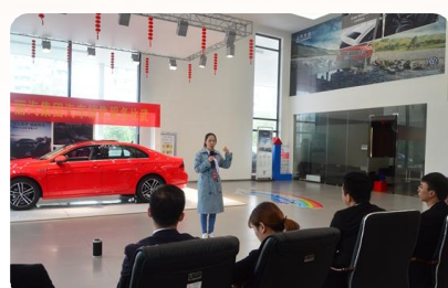
评委点评和观众亮分